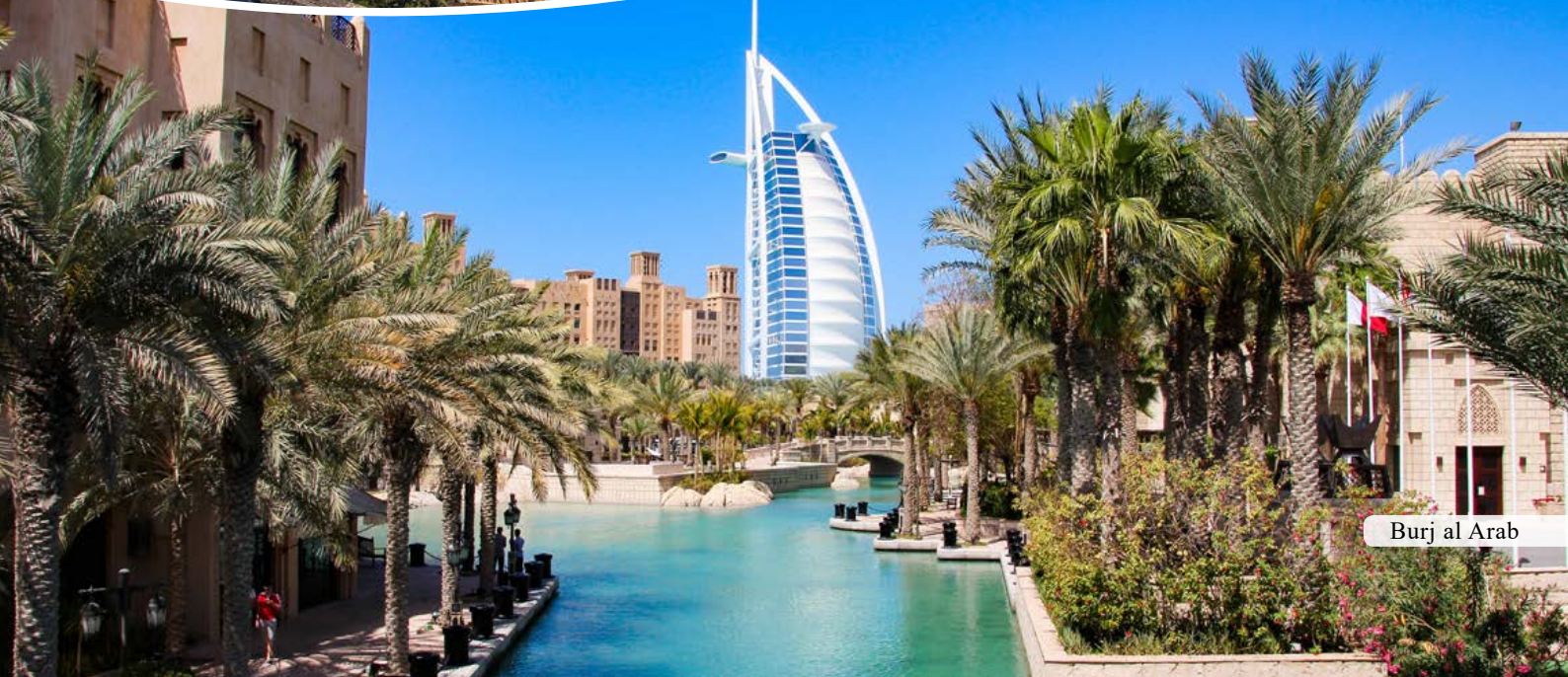
Burj al Arab