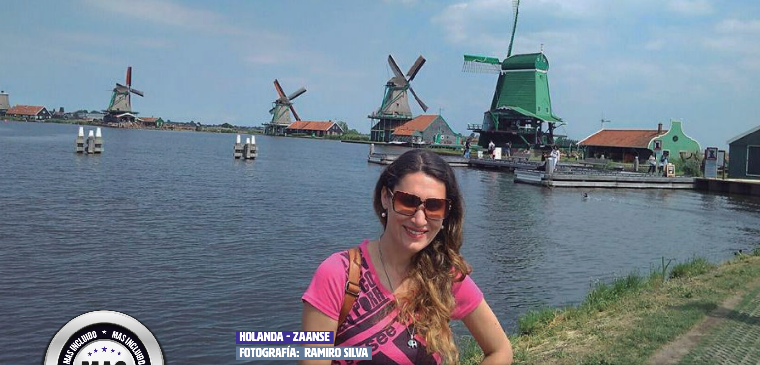
HOLANDA - Zaanse