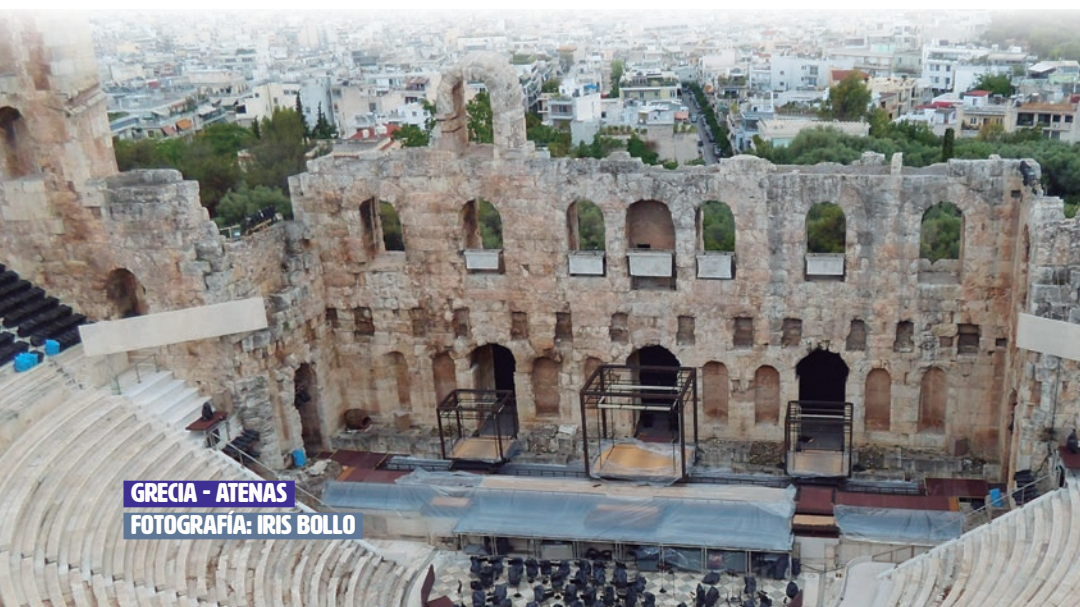
GRECIA - ATENAS