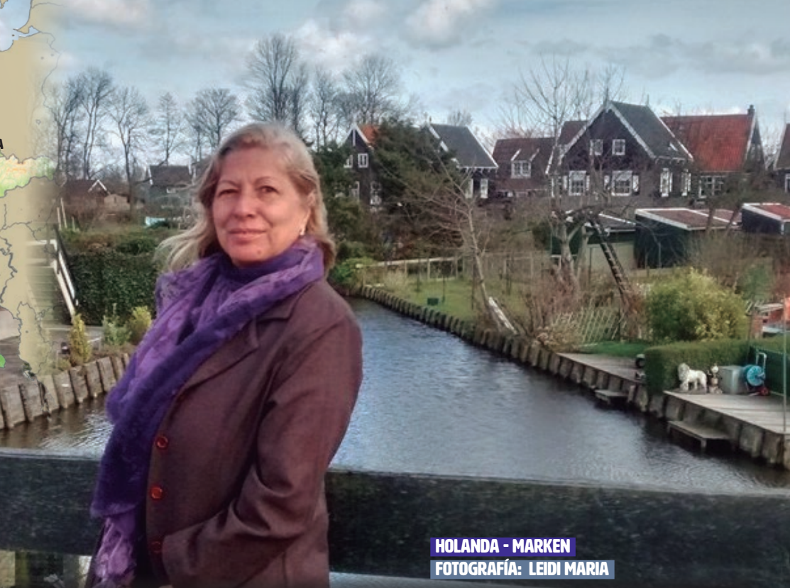
HOLANDA - MARKEN