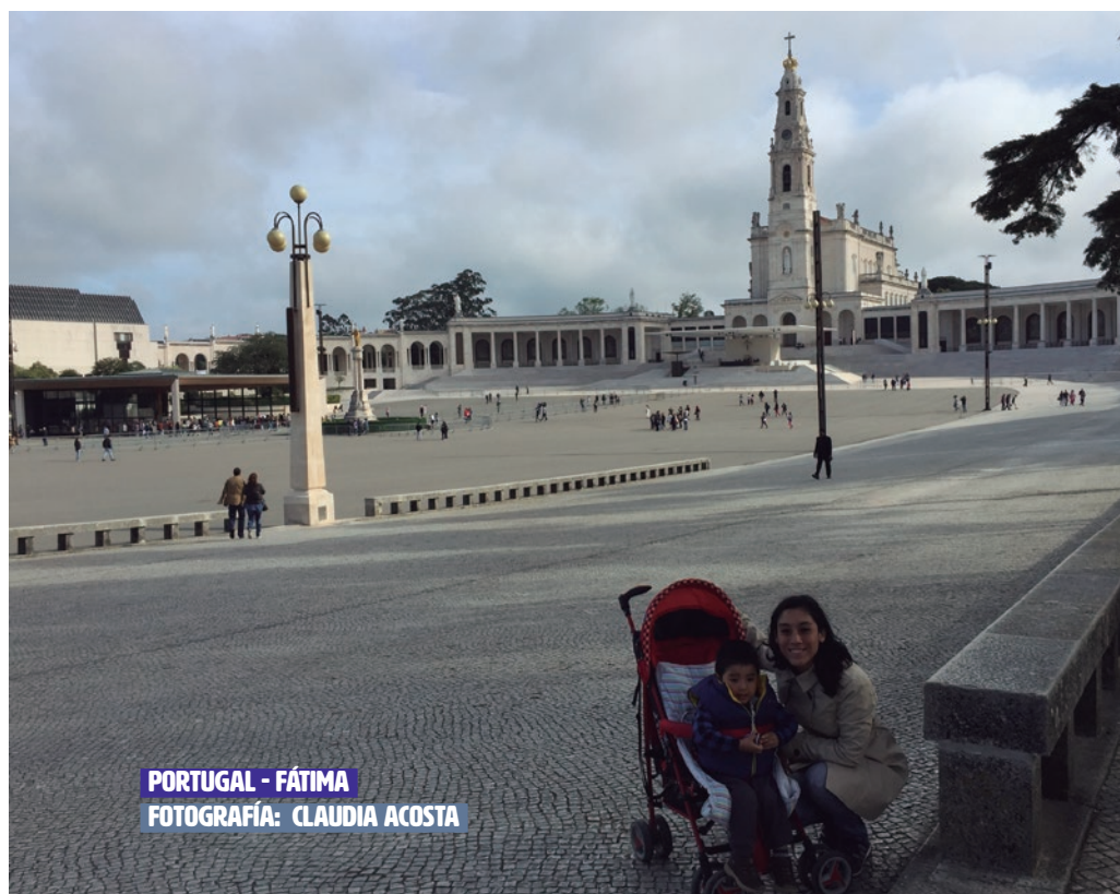
PORTUGAL - FÁTIMA