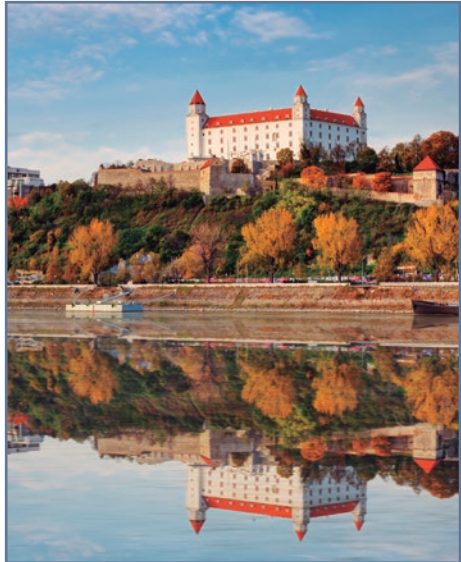
BRATISLAVA CIUDAD JUNTO AL DANUBIO

Después del desayuno, fin de nuestros servicios.