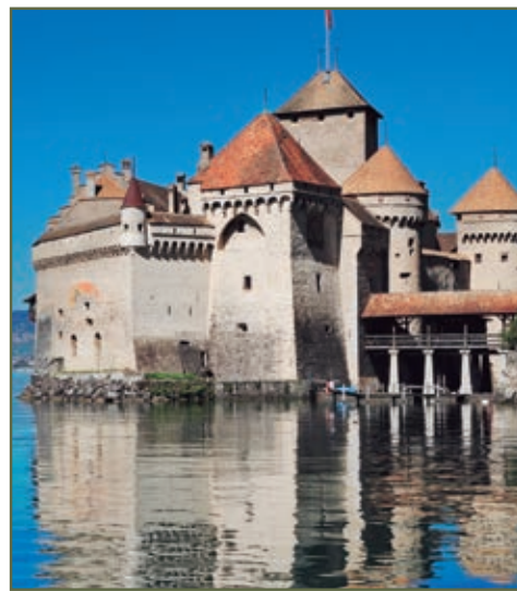
CASTILLO DE CHILLON