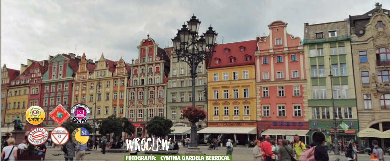
FOTOGRAFÍA: CYNTHIA GARDELA BERROCAL