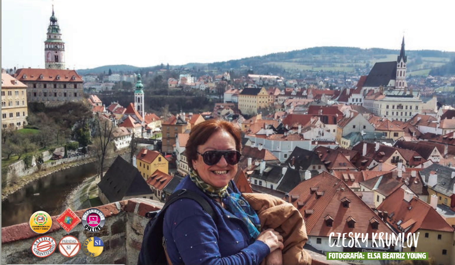
CZESKY KRUMLOV